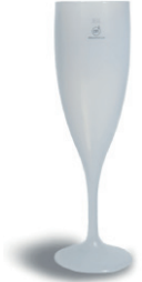
L00010 Flûte à champagne 120 pces/caisse