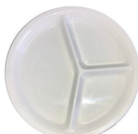
L10003 Assiette 3 comp. 50 pces/caisse