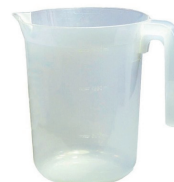
L30009 Pichet 1.4 L 50 pces/caisse