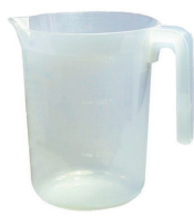
L30009 Pichet 1.4 L 50 pces/caisse