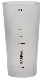
L00008 Verre 5 dl 160 pces/caisse