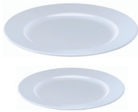
L10001 - Assiette 25 cm 50 pces/caisse L10002 - Assiette 20 cm 50 pces/caisse