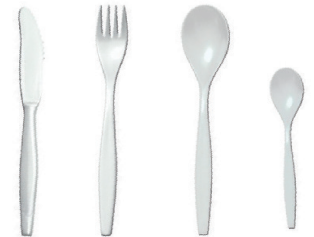
L20001 - Couteau 50 pces/sachet L20002 - Fourchette 50 pces/sachet L20003 - Cuillère à soupe 50 pces/sachet L20004 - Cuillère à café 50 pces/sachet