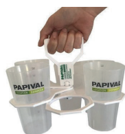
L70013 Porte verres 6x2.5dl