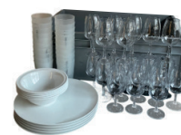
L50003 Kit Apéro 20 personnes