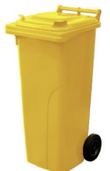
L70102 Collecteur 140L