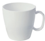
L00006 Tasse 230 ml 36 pces/caisse