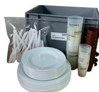
L50001 Kit Repas 10 personnes