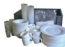
L50002 Kit Brunch 25 personnes