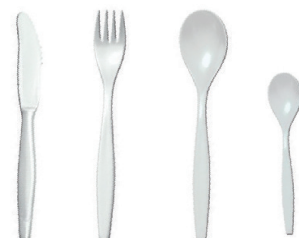
L20001 - Couteau 50 pces/sachet L20002 - Fourchette 50 pces/sachet L20003 - Cuillère à soupe 50 pces/sachet L20004 - Cuillère à café 50 pces/sachet