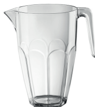
L30001 Pichet 2 L 10 pces/caisse